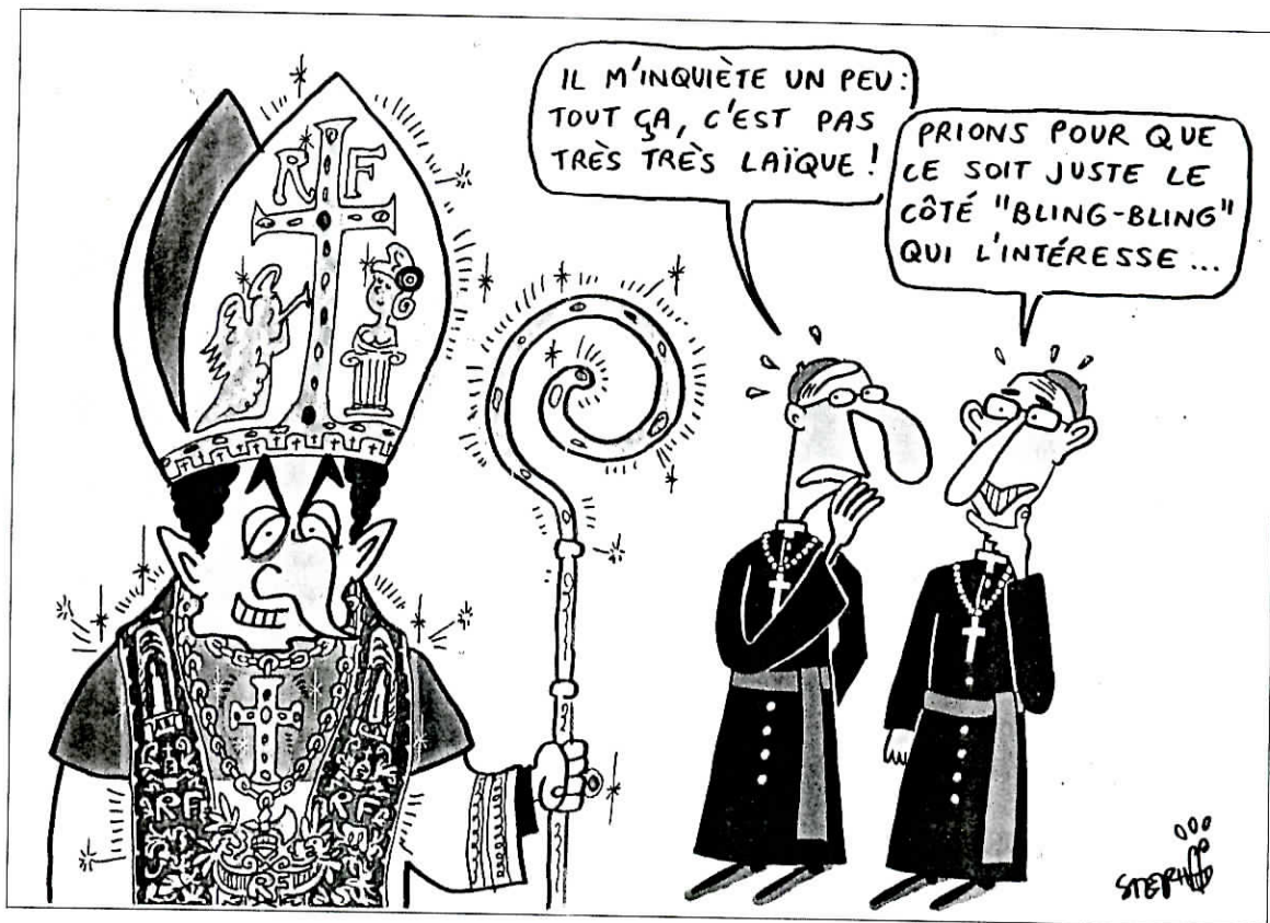
Dessin de Stephff pour le Monde des Religions.