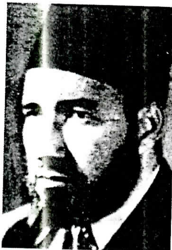
Hassan al-Banna (1906-1949), le fondateur des Frères musulmans.

Nous avons là tous les ingrédients d'une utopie théocratique et totalitaire dans le sens qu'Hannah Arendt assignait à ce terme. Plus précisément encore, l'islamisme est une « religion séculière », pour emprunter cette expression à Raymond Aron. Nonobstant son succès immédiat et l'efficacité de son élite politique qui pratiquait l'entrisme au sein de la police et de l'armée, l'association des Frères musulmans n'a pas réussi à prendre le pouvoir. Hassan al-Banna sera assassiné en 1949 et Saïd Qutb sera condamné à mort et pendu en 1966.