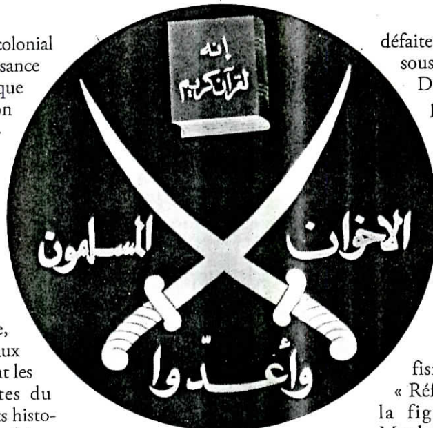
Le sabre et le Coran, l'emblème des Frères musulmans.

Nonobstant le décret de dissolution des Frères musulmans, la mort du « premier martyr » ne met pas fin à la croissance spectaculaire du mouvement, dont le succès s'explique par plusieurs facteurs. Au premier rang desquels, les consé-